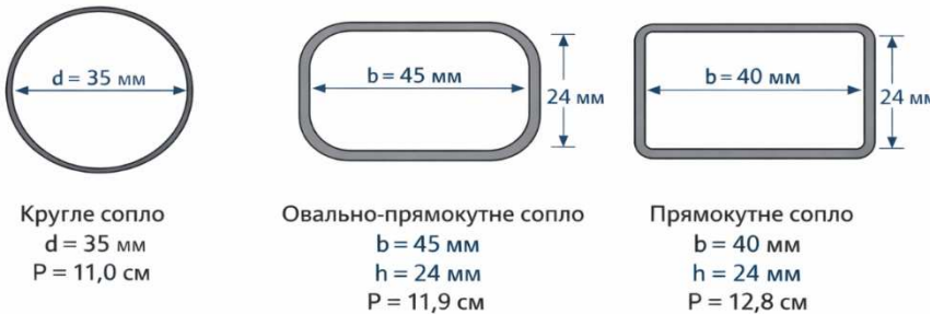
Рис. 1. Геометрія перерізів сопла 3D-принтера: а - кругле сопло; б – овально-прямокутне з заокругленими бічними сторонами; в - прямокутне сопло.

Для цього були виконані алгоритмізовані експерименти у відповідності до двохфакторного трьохрівневого плану B_2 [8]. Умови планування якого наведені в табл.1.