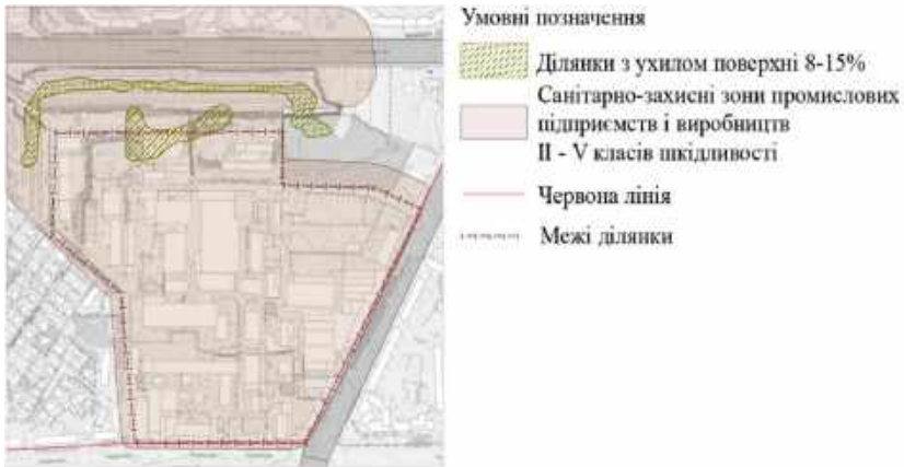
Рис.7. Схема планувальних обмежень

Розміщення знаходиться в санітарно-захисній зоні (рис.7). Рельєф здебільшого рівнинний про є територія з ухилом 8-15% .