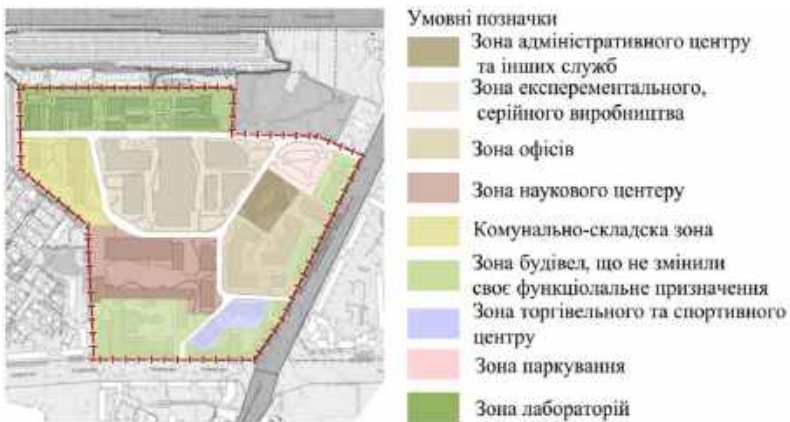
Рис.13. Схема зонування території після проведення реконструктивних заходів