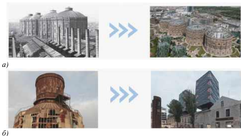
Рис. 3. Приклади реконструкції виробничих зон світу а) Віденські газометри – чотири колишні газгольдери, перетворені на багатофункціональний комплекс розділений на зони: житлову, офісну і розважальну. Повна ліквідація виробничої функції; б) Квартал Роттерманні в Таллінні – столярна майстерня, що отримала нове життя як сучасний офісний й центр. Повна ліквідація виробничої функції.

Постановка завдання: провести теоретичні дослідження з реконструкції поствиробничих територій та їх подальшої експлуатації; покращити та створити комфортні умови на досліджуваній ділянці території м. Рівне з врахуванням нормативних вимог та потреб усіх користувачів.