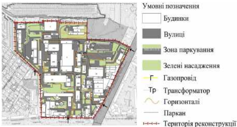
Рис.10. Генплан території

При проведенні досліджень поточного стану території, та розумінні всіх мінусів та плюсів було вирішено здійснити реконструктивні заходи (рис.11):