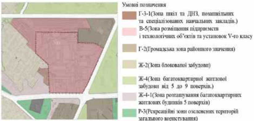
Рис. 6. Зонування територій довкола обраної ділянки

Зонування територій (рис.6). Територія межує з багатьма функціональними зонами, проте найбільше її оточують території житлової садибної та багатоповерхової забудови.