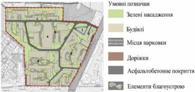
Рис.12. Генплан в результаті застосування реконструктивних заходів:

Висновок. На генплані (рис.12), можна побачити результат втілення досліджень, за допомогою заходів з реконструкції території. Розроблено нове планування доріжок, які ділять територію на зони (рис.13), та створюють зручну систему пересування, за рахунок об'єднання всіх зон в єдину пішохідну мережу. Запроектовано пішохідний бульвар в науковій зоні та офісній, а також розміщено багато зелених островів в середині кварталів. Продумано розміщення місць для паркування робітників та відвідувачів території. Запропоновано, здійснити заходи з озеленення фасадів та дахів будівель а також до уваги взято, використання більш екологічних матеріалів в благоустрої території.