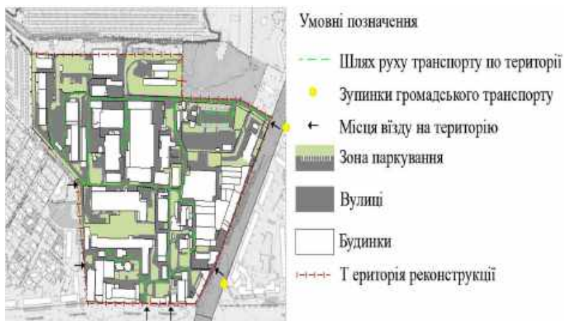
Рис.8. Схема транспортного обслуговування та пішохідних зв'язків

Територія озеленена хаотично (рис.9), перебуває у занедбаному стані з заростями чагарників. Загальний рівень озеленення складає лише 19,1% від загальної площі, що має негативний вплив на екологічну ситуацію.