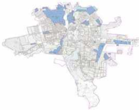
Рис. 1. Розташування виробничих зон м. Рівне: – території виробничої зони

Аналіз останніх досліджень. При аналізі останніх досліджень (рис.2, 3) можна виділити три напрямки реконструктивних заходів [ Ошибка! Источник ссылки не найден. ]: