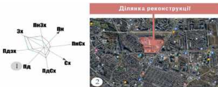
Рис. 4. Ситуаційна схема: 1 – роза вітрів; 2 – ситуаційна схема.

Результати досліджень. Для реконструкції було обрано виробничу територію м. Рівне, що знаходиться в північно східній частині міста та має вигідне положення в містобудівній схемі (рис.4). Ділянка відноситься до V класу шкідливості із низьким ступенем шкідливого впливу на людей і навколишня середовище. На ділянці відбуваються постійні зміни малих підприємств, спорудження малих допоміжних споруд.