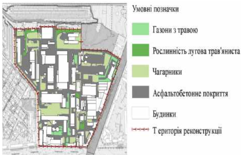
Рис.9. Схема озеленення території