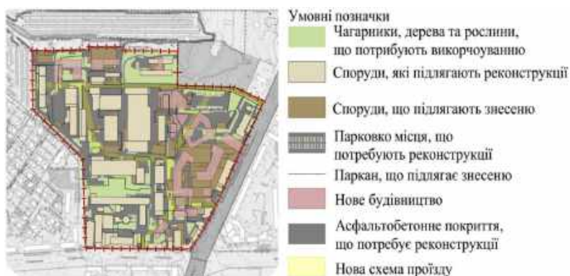
Рис.11. Схема реконструктивних заходів